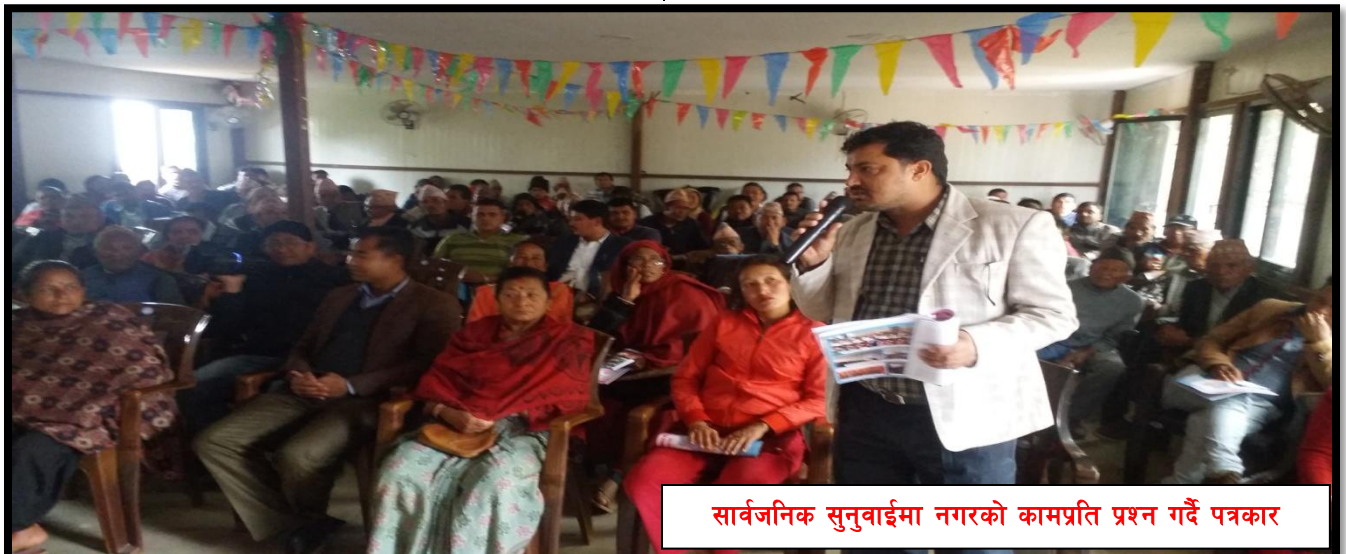
सार्वजनिक सुनुवाईमा नगरको कामप्रति प्रश्न गर्दै पत्रकार