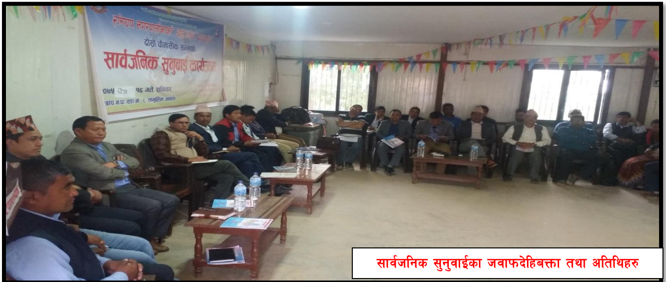
सार्वजनिक सुनुवाईका जवाफदेहिबक्ता तथा अतिथिहरु