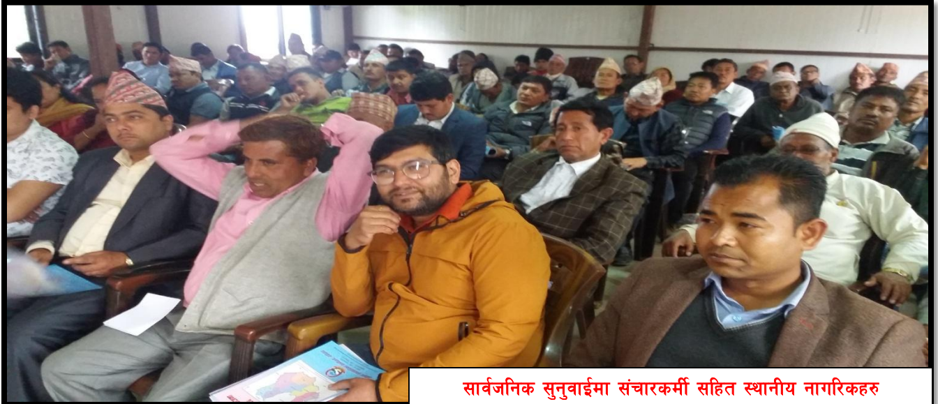
सार्वजनिक सुनुवाईमा संचारकर्मी सहित स्थानीय नागरिकहरु